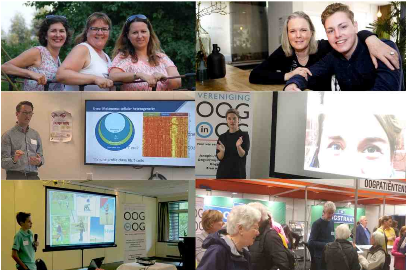
Foto-impressie van de verschillende beurzen, bijeenkomsten of artikelen uit onze magazines.

Ministerie van VWS/Fonds PGO, onze donateurs, vrijwilligers, samenwerkingspartners en onze leden.