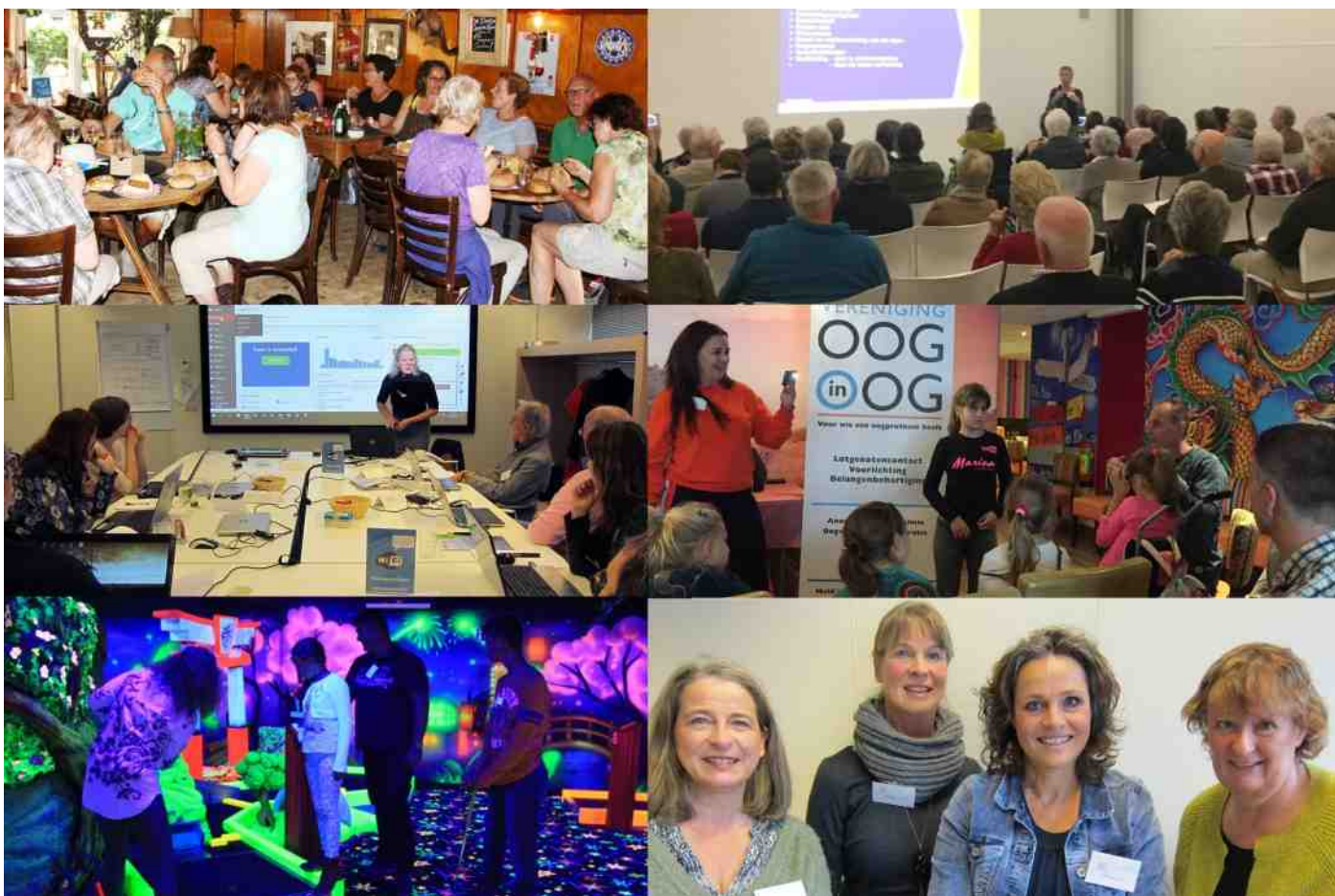
Foto-impressie van de verschillende beurzen, bijeenkomsten of artikelen uit ons magazine.