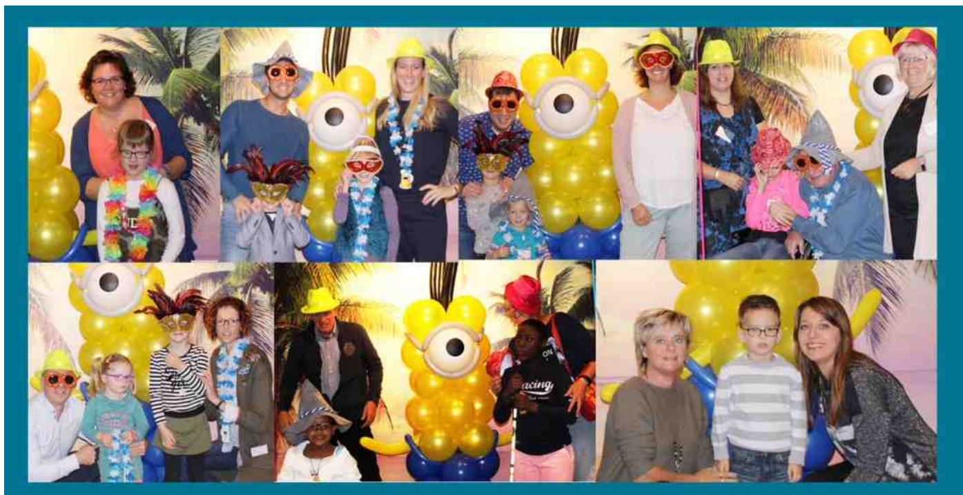
Familedag 2017: Bij binnenkomst werden de deelnemertjes samen met hun vader/moeder, broertjes, zusjes opa's/loma's op de foto gezet.