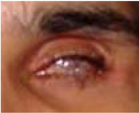
Afbeelding 1. Een blind, pijnlijk linker oog, na een trauma op kinderleeftijd.

Dr. Kalmann: “Het moeten missen van een oog is een ingrijpende gebeurtenis.