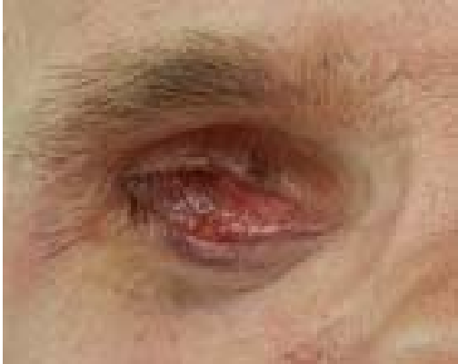
Afbeelding 8. Contracted socket