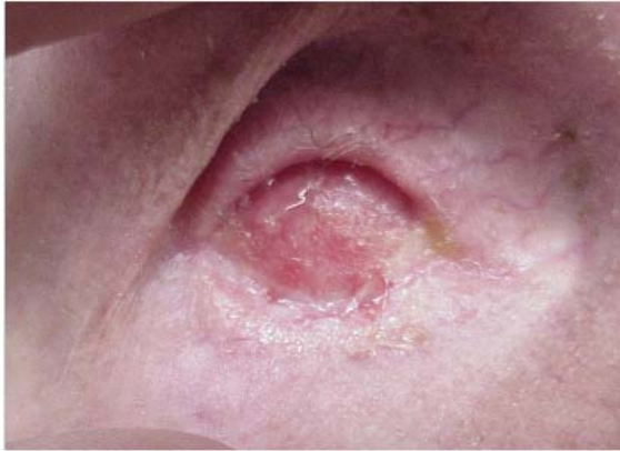
Afbeelding 3C. Zogenaamde contracted socket, waarbij het slijmvlies is verlittekend