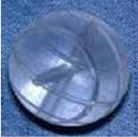
Afbeelding 2A. Een voorbeeld van een acrylbolletje