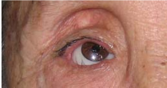
Afbeelding 7. PESS met diep liggende prothese, omhooggetrokken bovenooglid en afscheiding