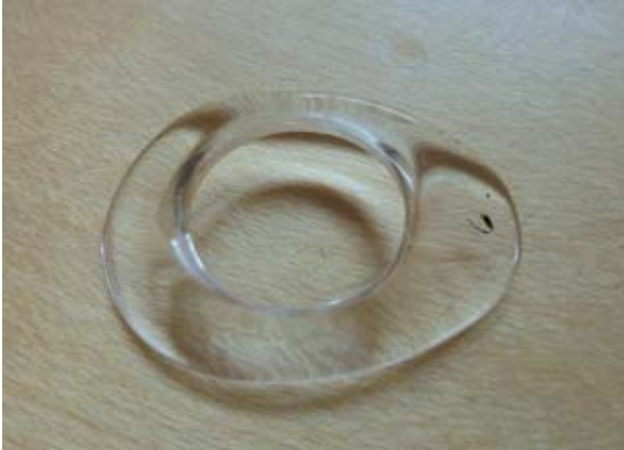
Afbeelding 4. Een Illigschaaltje

Na een oogverwijderingsoperatie mag de patiënt, nadat het drukverband is verwijderd, meestal de volgende dag naar huis. Om verklevingen te voorkomen wordt er altijd een Illig-schaaltje in de holte achtergelaten.