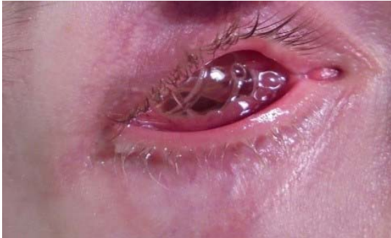
Afbeelding 6. Wijkend slijmvlies