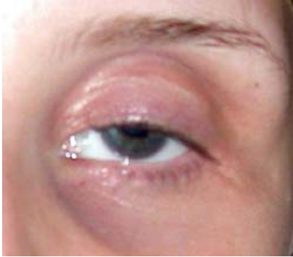
Afbeelding 9. Hangend ooglid links na evisceratie