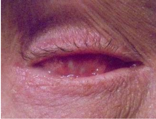
Afbeelding 5. Evisceratie holte, 5 weken na de operatie

“Na een week of vier kan er een prothese aangemeten worden door de prothesioloog/ocularist. Meestal is de holte dan rustig en is de meeste zwelling weggetrokken, zie afbeelding 5.”