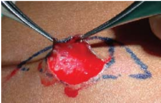
Afbeelding 3B. Dermis-fat graft