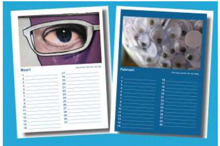
De verjaardagskalender (zie pag. 11)

Via de Oogvereniging wordt OOG in OOG betrokken bij meerdere trajecten. Zo werken wij mee aan de nieuwe behandelrichtlijn Blefaroplastiek van boven- en onderoogleden, correctie ptosis bovenoogleden en wenkbrauwen voorhoofdslift.