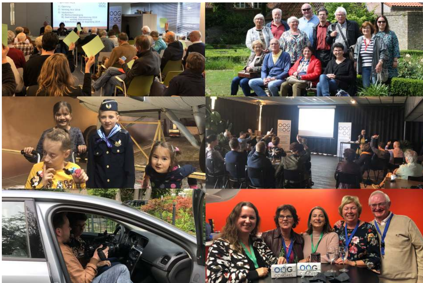
Foto-impresie van de verschillende beurzen, bijeenkomsten of artikelen uit onze magazines.